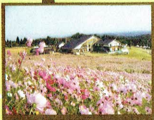
夢の平スキー場 10月にはコスモスウッチングが開催されるなど、スキーだけでなく、1年を通して楽しめるスポット。